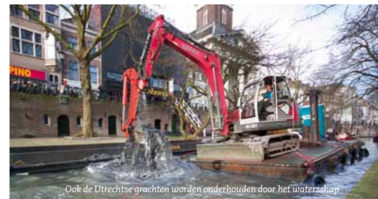
Ook de Utrechtse grachten worden onderhouden door het waterschap

HDSR werkt in een groot deel van de provincie Utrecht en een stukje van Zuidholland. In de provincie Utrecht werken verder de waterschappen Vallei en Veluwe en Rivierenland, en het Hoogheemraadschap Amstel, Gooi en Vecht.