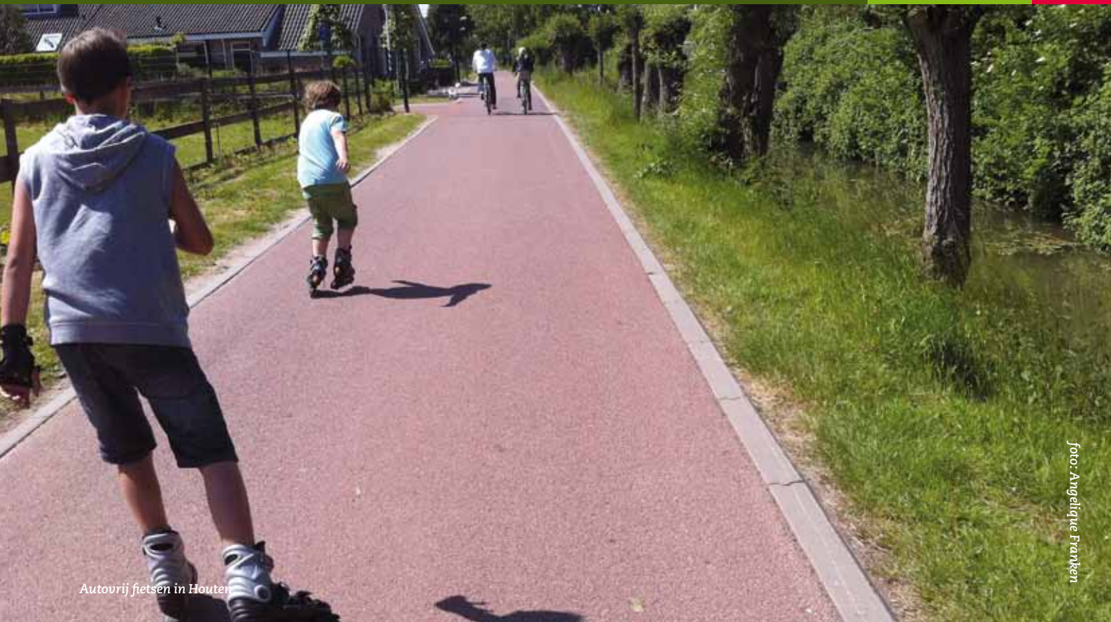
Autovrij fietsen in Houter