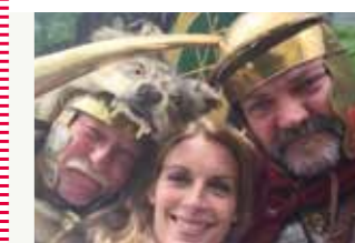
Romeinselfie bij het mobiele infocentrum Limes

22 mei > Romeinselfie bij het mobiele infocentrum #Limes. (Let op die wolvenkop!) pic.twitter.com/IUe1f4FnZA