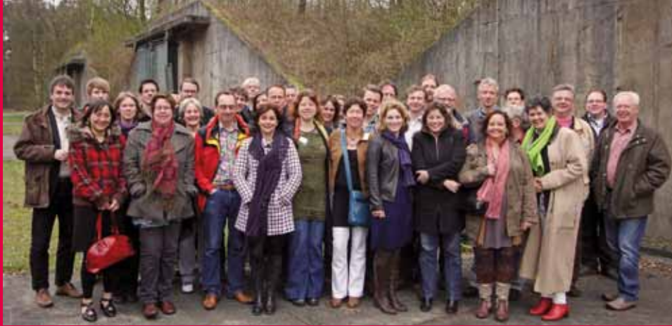
Op 30 maart bezocht GroenLinks Tweede Kamerfractievoorzitter Jolande Sap samen met een afvaardiging van de Tweede Kamerfractie, Eerste Kamerlid Ruud Ganzevoort, Europarlementariër Bas Eickhout en verschillende provinciale en lokale raads- en bestuursleden de provincie Utrecht. Hier een foto-impressie van deze tour. Op http://provincieutrecht.groenlinks.nl/Saptour is een verslag van deze tour verschenen.