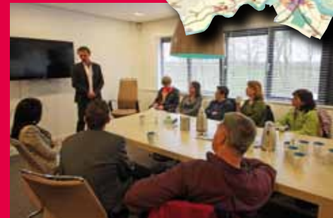
Amersfoort: de leiding van Arbeidstrainingscentrum (ATC) Match vertelt over de succesvolle wijze waarop zij probleemjongeren naar de arbeidsmarkt brengt. Helaas vindt de Onderwijsinspectie het een zwakke school: men beschikt niet over klaslokalen.