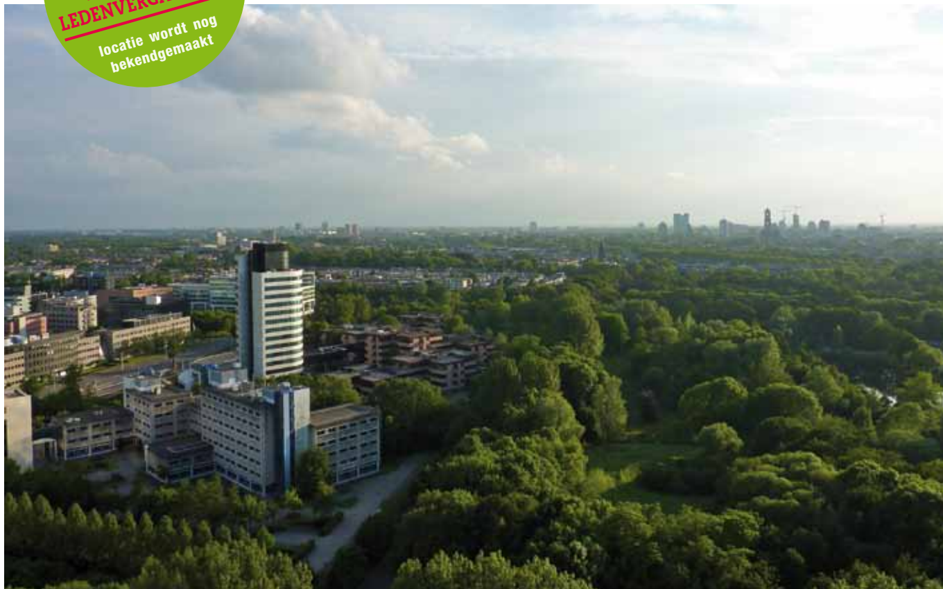
UITZICHT OVER HET OUDE PROVINCIEHUIS, UTRECHT STAD, EN DE REST VAN DE PROVINCIE VANUIT HET NIEUWE PROVINCIEHUIS

HET LEDENBLAD VAN STATENFRACTIE EN BESTUUR VAN GROENLINKS PROVINCIE UTRECHT • JULI 2012 • INHOUDSOPGAVE • (1-2-3) OPEN EN TOEKOMSTGERICHT • (2) REDACTIONEEL • (3) TWEETS VAN GEDEPUTEERDE MARIËTTE PENNARTS • (4-5) EEN RONDJE DOOR DE PROVINCIE MET JOLANDE SAP • (4-5) KORT: VAN DE FRACTIE • (6) COLUMN • (6) NIEUW EN OUD, PROVINCIEHUIZEN DOOR DE JAREN HEEN • (7) BAKERMAT VAN DEMOCRATIE IN DE GELDERSE VALLEI • (8) EVEN VOORSTELLEN • RETOURADRES POSTBUS 80300, KAMER 17.47, 3508 TH UTRECHT