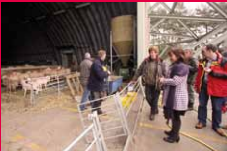
Soesterberg: Waar ooit straaljagers stonden vinden nu schapen onderdak.