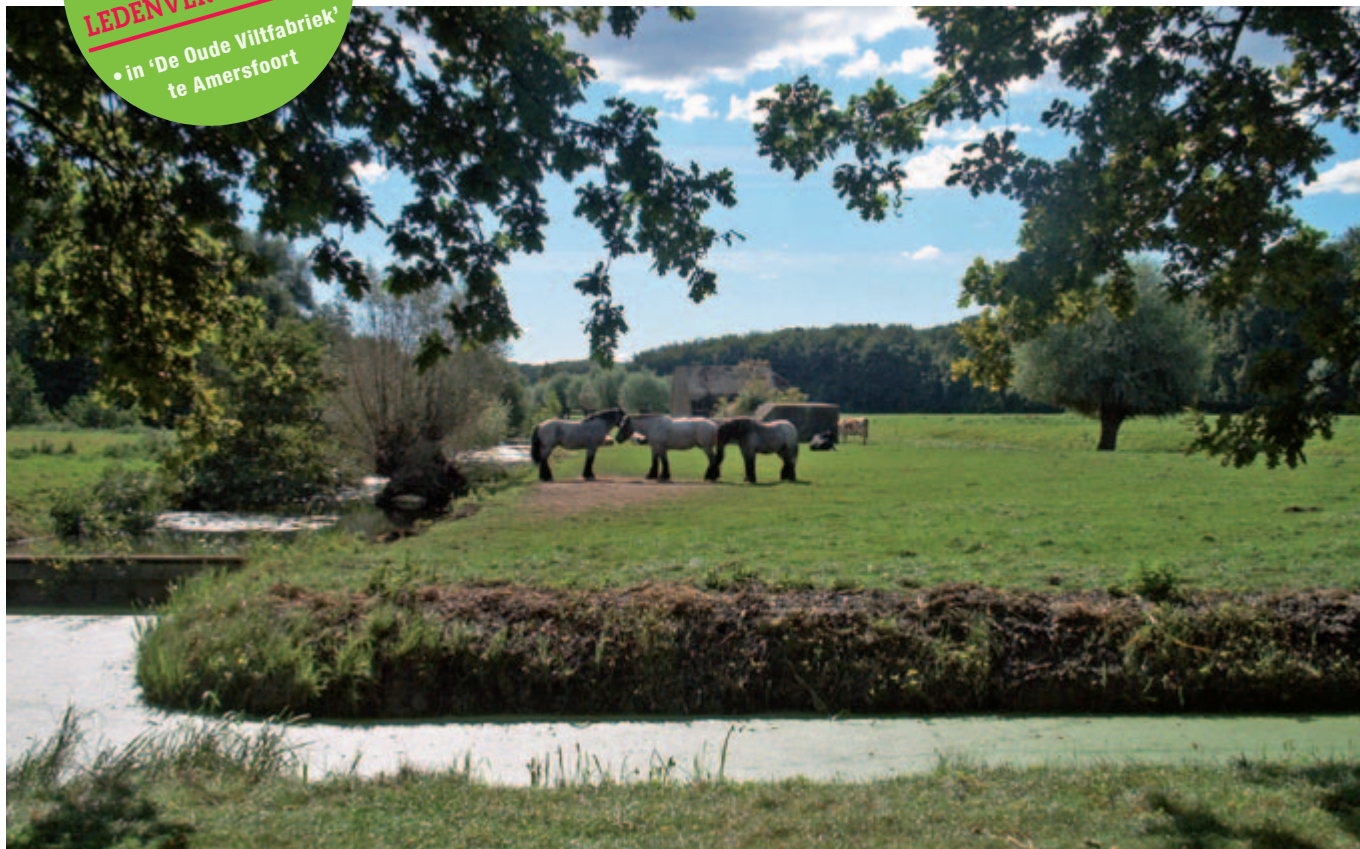
IN AMELISWEERD KOMEN JAARLIJKS 1,5 MILJOEN MENSEN RECREËREN.

• in 'De Oude Viltfabriek' te Amersfoort