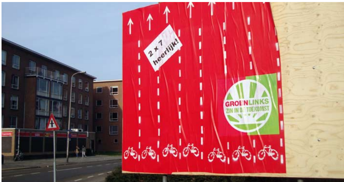
GROENLINKS WIL FIETSBANEN IN UTRECHT, GEEN FILEBANEN!