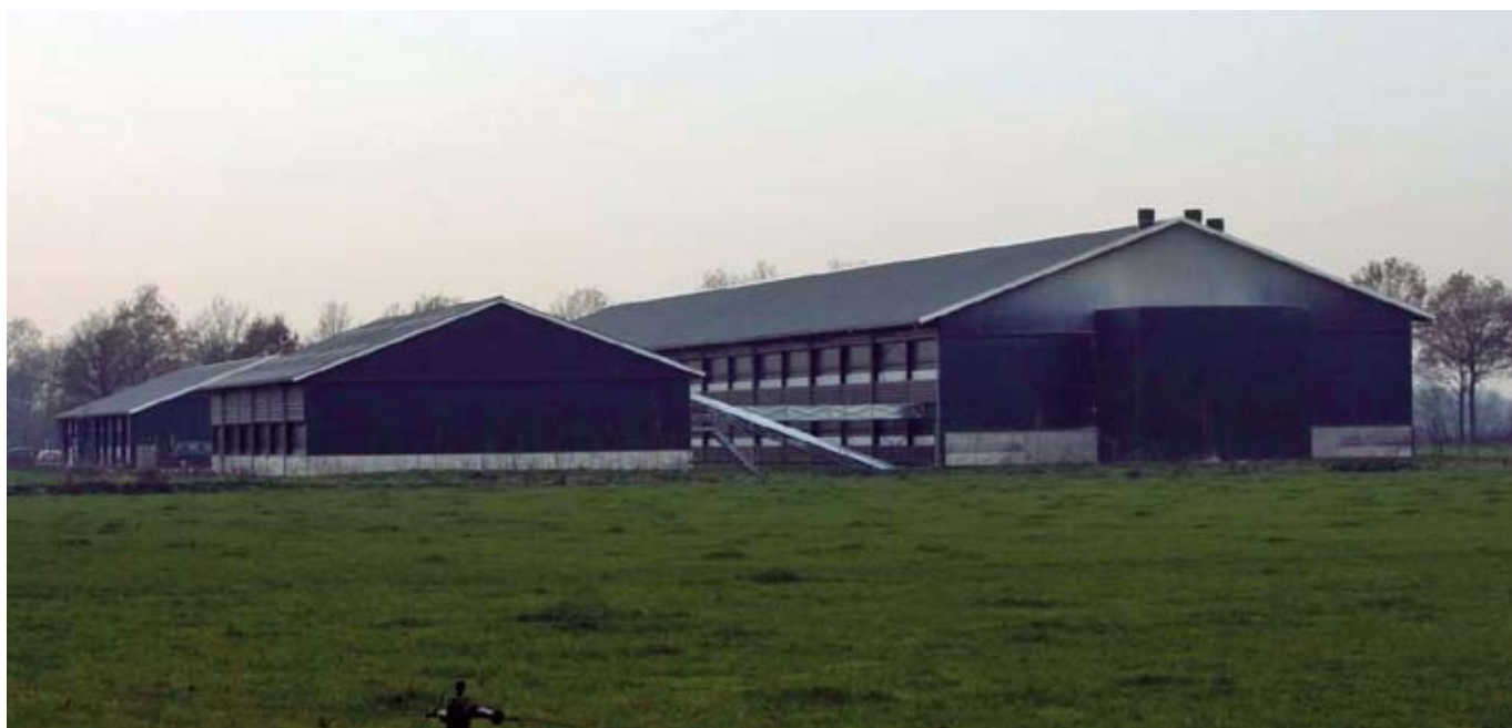
MEGASTALLEN: VERLEDEN, HEDEN, OF TOEKOMST?

Als alles volgens plan gaat, stemmen Provinciale Staten maandag 7 februari in met het burgerinitiatief van Milieudefensie tegen de komst van megastallen in de provincie als uitwas van de intensieve veehouderij. Een bijzonder succes in een provincie, waar het CDA (nog) de grootste partij is. Maar daarmee begint het debat over de toekomst van de landbouw in onze provincie pas echt.