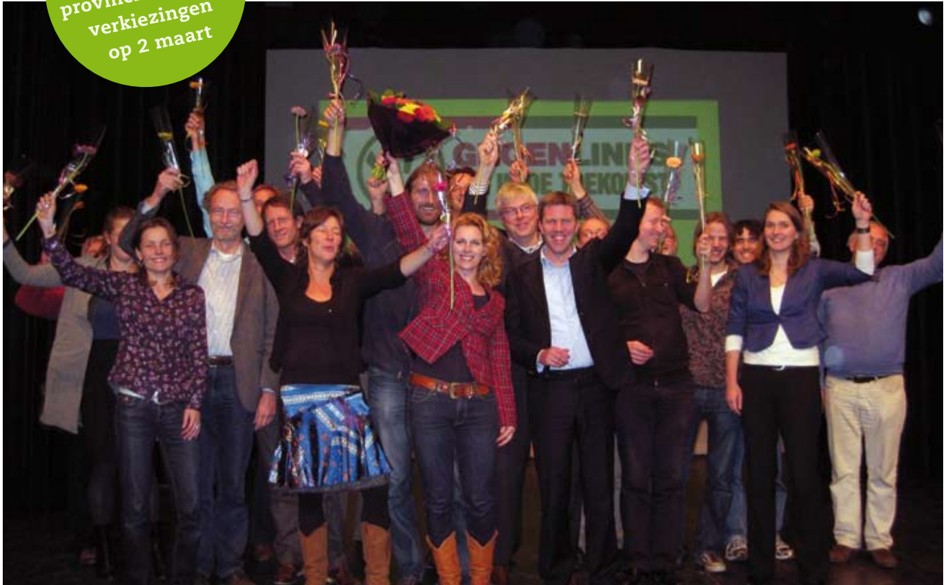
ALLE KANDIDATEN NA DE VASTSTELLING VAN DE KANDIDATENLIJST BIJ DE PLV VAN GROENLINKS IN NOVEMBER

provinciale staten verkiezingen op 2 maart