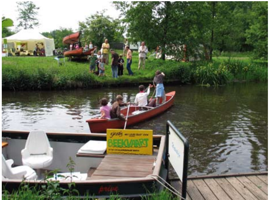
HET HEILIGENBERGERBEEKDAL: PARK RANDENBROEK IN AMERSFOORT

geheel wordt opgeheven, is nu een stevig punt van discussie. GroenLinks vindt het vreemd om voor gebieden met een beoogde natuurfunctie een ontheffing te geven om nog eens extra te vermesten. Het voorstel is een poging om 'te redden wat er te redden valt'. Het betekent echter een enorme terugval naar een beleid van ecologische armoede. In de 'Staat