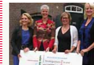
Op fort Altena