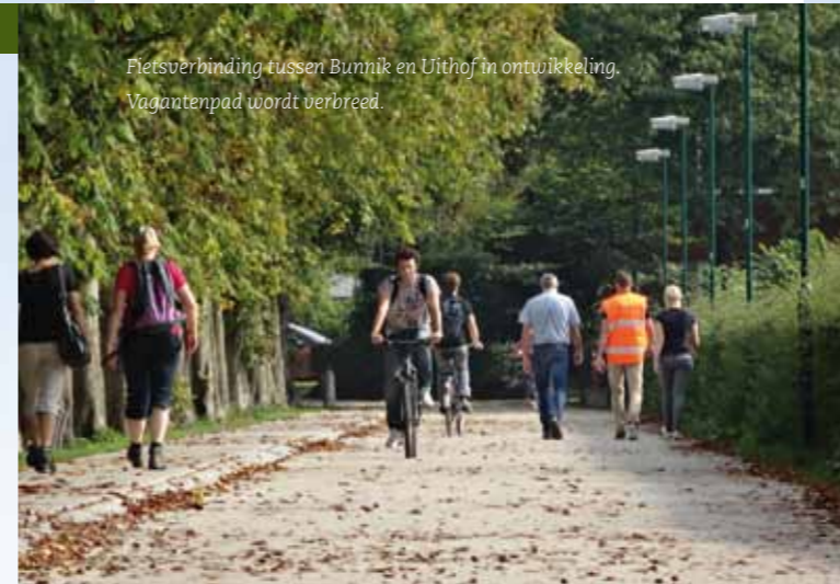
Fietsverbinding tussen Bunnik en Uithof in ontwikkeling. Vagantenpad wordt verbreed.