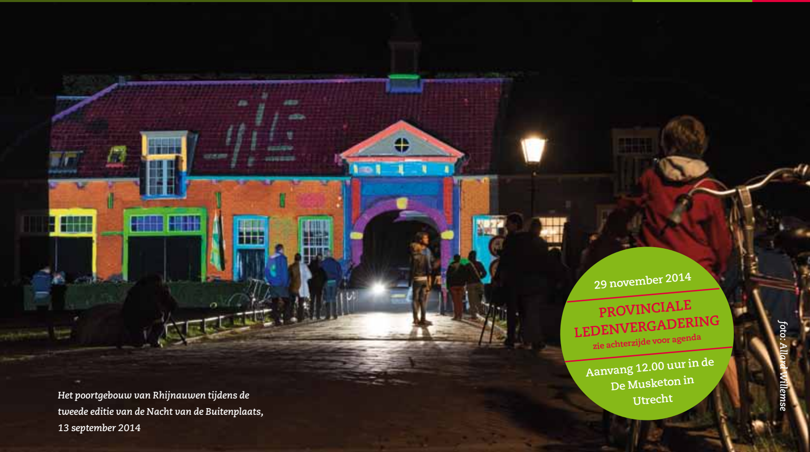
Het poortgebouw van Rhijnauwen tijdens de tweede editie van de Nacht van de Buitenplaats, 13 september 2014

29 november 2014 PROVINCIALE LEDENVERGADERING zie achterzijde voor agenda Aanvang 12.00 uur in de De Musketon in Utrecht