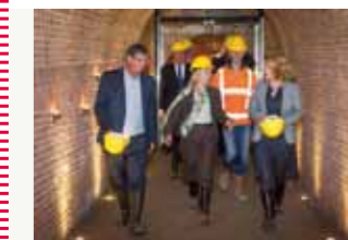
In fort Vechten

2 okt. > Op fort Altena met 4 provincies gestart met next step Nwe Hollandse Waterlinie 220km cultuur/natuur/recreatie #Unesco