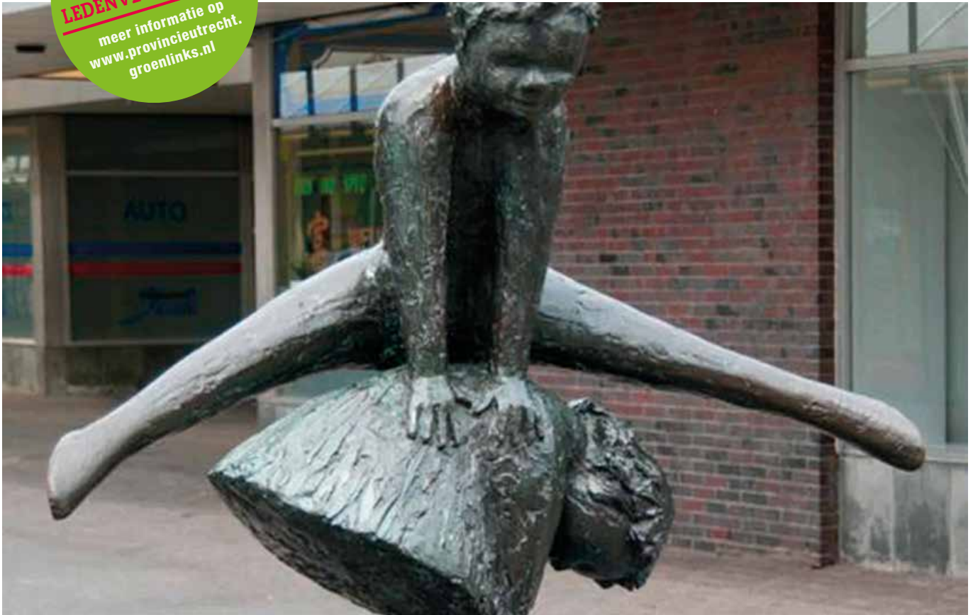
'TWEË HAASJE-OVER SPELENDE KINDEREN' • HENK TIEMAN (DEN HAAG 1921-ROTTERDAM 2001), BEELDHOUWER

meer informatie op www.provincieutrecht.groenlinks.nl