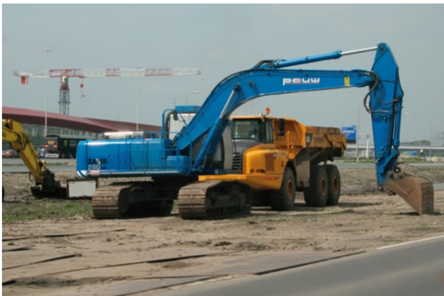
VERBREDING A2, KOMT ER NOG MEER ASFALT?

regio. De wachttijd bij verkeerslichten wordt verminderd en er komen auto-fiets transferia. • Aanpakken van de bevoorradingsgebieden voor kortere reistijden, hogere betrouwbaarheid, minder milieubelasting en betere ver-