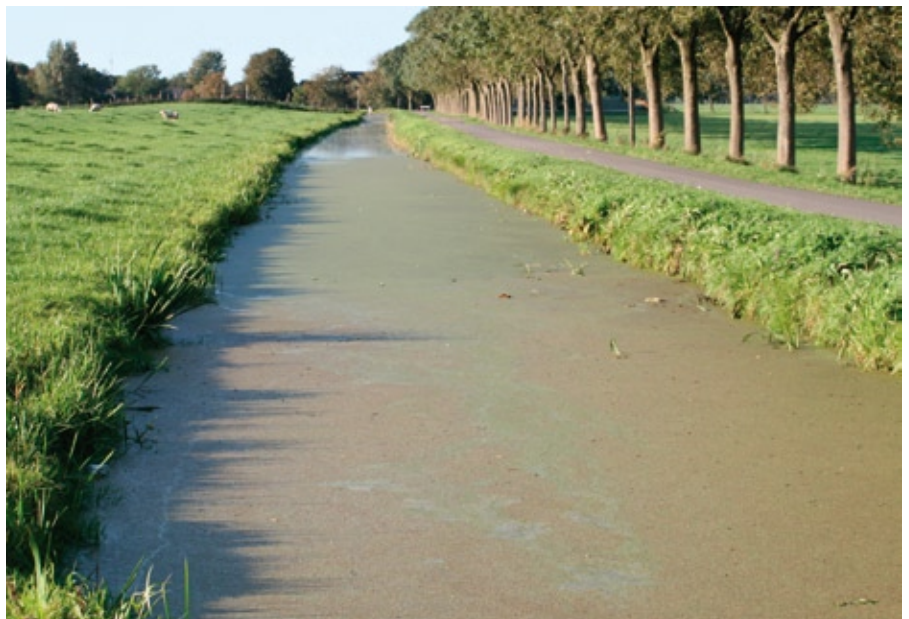
VERVUILD WATER IN DE POLDER

De verkenningen van de provincie en het waterschap Amstel, Gooi en Vecht schetsten een aantal varianten. De varianten Plas en Ophogen verbeteren de waterkwaliteit in de omgeving substantieel; de andere varianten doen dat veel minder of niet. De variant Plas is de enige strategie die waterberging en verbetering waterkwaliteit combineert. GroenLinks heeft gedeputeerde Binnenkamp wel gevraagd om bij de uitwerking van die variant te kijken naar het idee van de